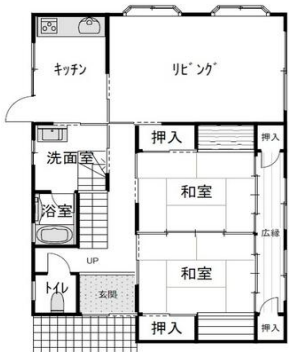
1階 縮尺 1/100